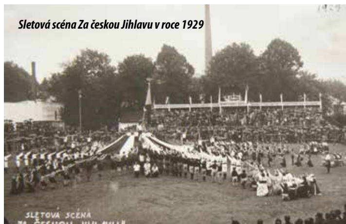
Sletová scéna Za českou Jihlavu v roce 1929