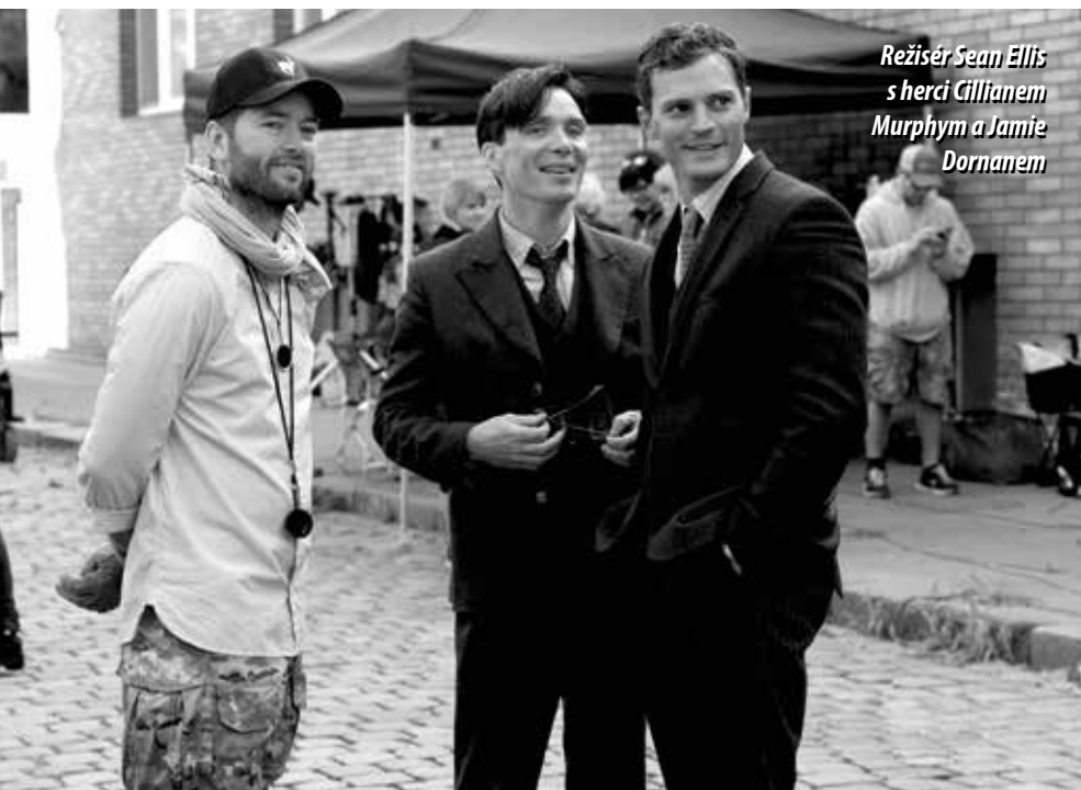
Režisér Sean Ellis s herci Cillianem Murphyem a Jamie Dornanem