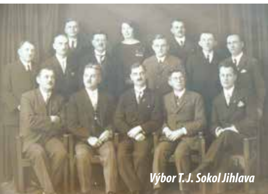
Výbor T. J. Sokol Jihlava