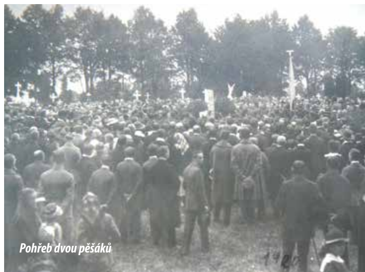
Pohřeb dvou pěšáků