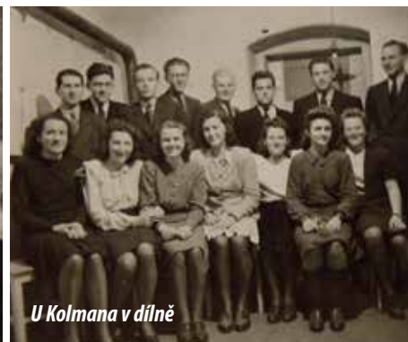
U Kolmana v dílně