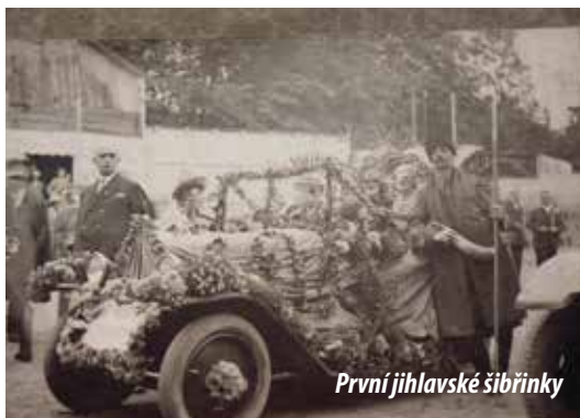
První jihlavské šibřinky