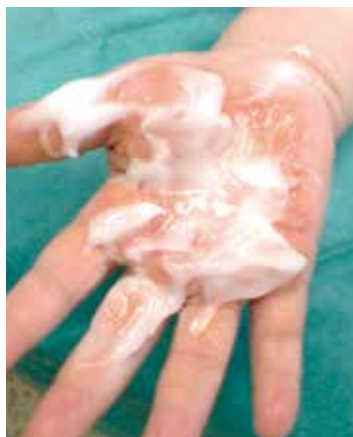
Popálenina dlaně po perforaci puchýřů a aplikaci gelového obvazu před přiložením gázy

Jak tedy správně a efektivně postupovat? Všechny popáleniny většího rozsahu vyžadují odbornou pomoc, děti do 15 let věku by měly být vyšetřeny vždy. Lokálně vždy můžeme, jak již bylo uvedeno, chladit do vymizení bolesti, u dětí do 3 let věku chladíme pouze krátce jednorázově (cca 1–2 minuty), protože