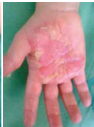
Zhojená dlaň po dvou převazech a deseti dnech od úrazu

dětský organismus je termoregulačně značně labilní a děti upadají velmi rychle do šokového stavu z prochladnutí. Nikdy nechladíme postižené místo ledem, protože led způsobuje sice rychlý ústup bolesti, ale současně i vazokonstrikci (stažení – zúžení cév) a tím rychlé prohloubení a zhoršení stupně popáleniny. Plochy dále můžeme ošetřit antiseptickým prostředkem (Betadine solution, Prontosan – volně dostupné) a následně vrstvou gelu a překrýt v dostatečné vrstvě gázovým obvazem. Před přiložením gelu odstraňujeme nebo alespoň perforujeme puchýře, protože jinak dochází k dalšímu hromadění tekutiny v postiženém místě a tím k prohlubování stupně popáleniny.