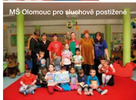
MŠ Olomouc pro sluchově postižené