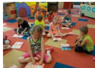
Práce se sešitem v MŠ Pardubice-Jesničky

Třetí ročník projektu, do kterého nyní probíhá registrace, je připraven ke startu od začátku školního roku 2018/2019. V případě zájmu či podrobnějších informací se můžete obrátit na koordinátorku projektu na e-mail akujanova@sokol.eu .