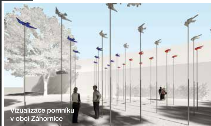
Vizualizace pomníku v obci Záhornice