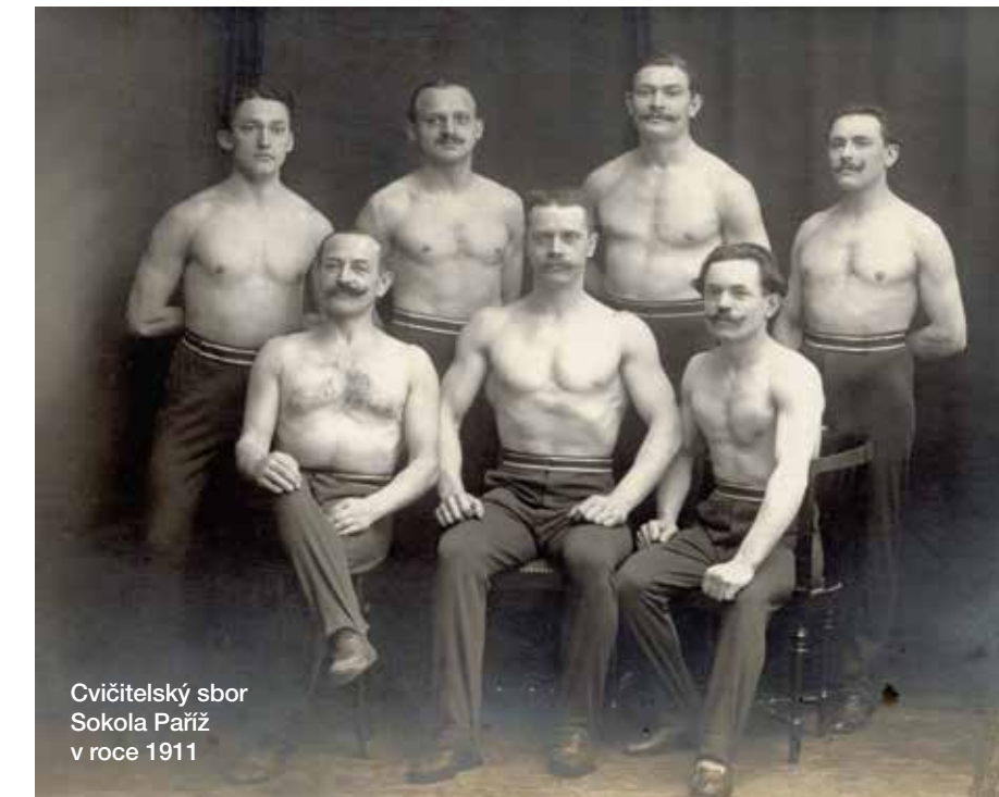
Cvičitelský sbor Sokola Paříž v roce 1911

Kromě sportovní činnosti jsme udržovali i kulturní a společenské tradice. Uspořádali jsme například vzpomínkový večer věnovaný Jaroslavu Seifertovi, pořad ke stému výročí narození Voskovce a Wericha, několik koncertů a výstav. Ke 125. výročí