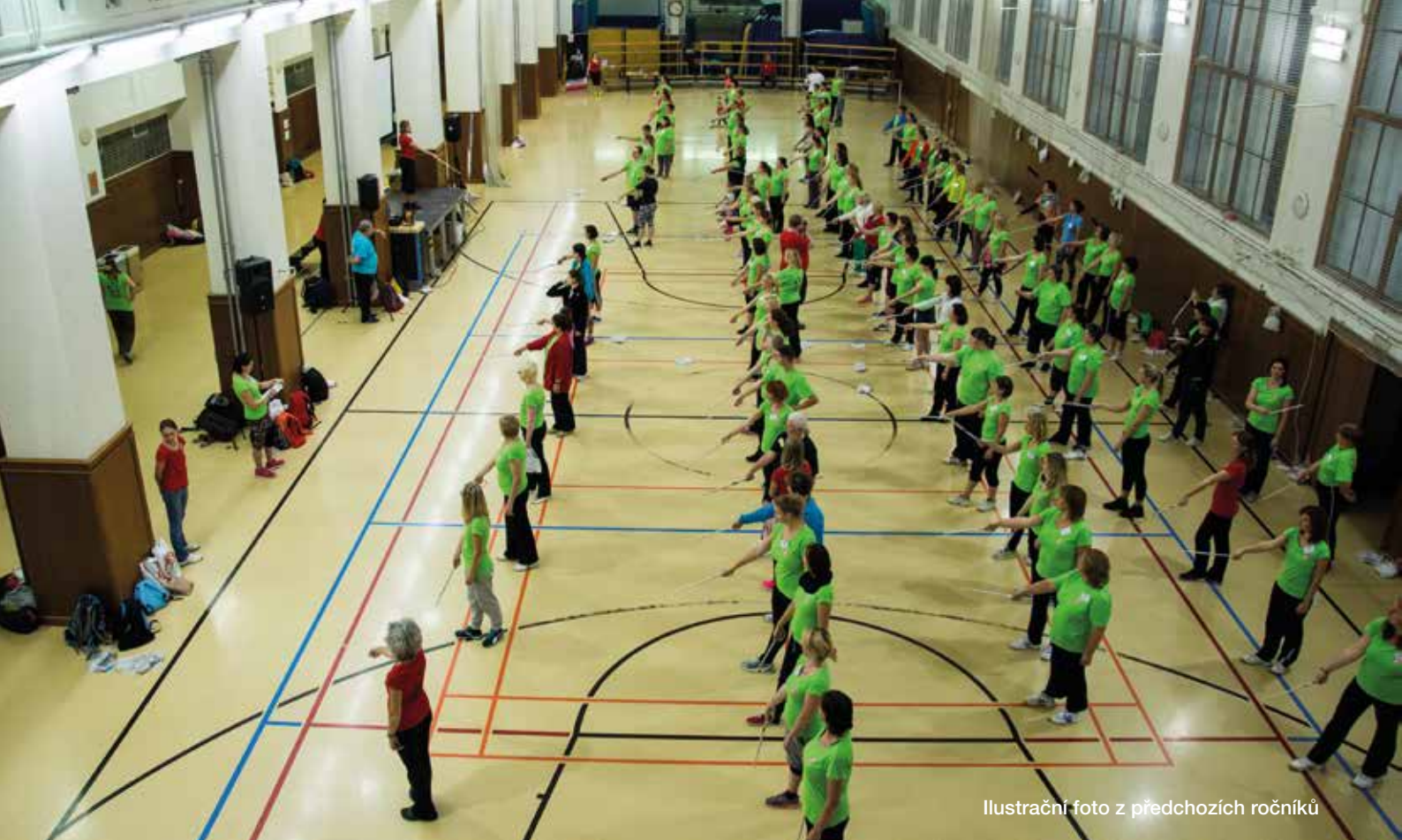
Ilustrační foto z předchozích ročníků