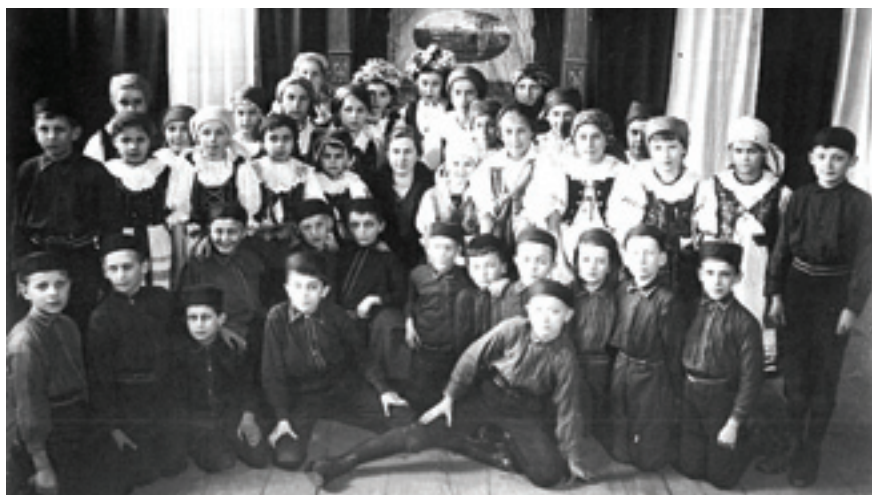
Děti před oponou v Příbyslavi