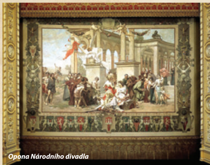
Opona Národního divadla