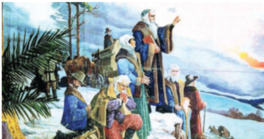
J. A. Komenský se loučí s vlastní, Velký Újezd

Divadelní opony mají v českém umění od 18. století do dneška zvláštní postavení. Na jedné straně jsou spojeny s utvářením masové kultury (u nás většinou ve skromných podmínkách), na druhé straně se v jejich motivech odrážejí úkoly, touhy i sny společnosti, jež sahají od každodenní praxe až k mýtu a posvátnu. Hodnoty, ke kterým se opony odvolávaly a jejichž prvky opakovaly, byly vázány k různorodým kulturním konvencím a pojmány s různou mírou zobecnění. Obrazové náměty opon českého divadla byly většinou prochnuty vlasteneckou tendencí oslavit dějiny, sídlo a krajinu, umělecké památky, zvyky, osoby a události. Divadelní opony jsou jedním z významných dokumentů českého národního obrození a jeho ohlasu v nejširších společenských vrstvách české společnosti. Někdy se pro ztvárnění divadelních opon podařilo získat významné malíře – umělci, zvláště ti začínající, se ostatně často sami snažili při jejich vzniku uplatnit –, jindy byly