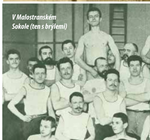
V Malostranském Sokole (ten s brýlemi)