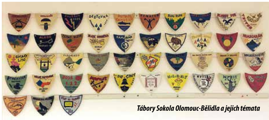
Tábory Sokola Olomouc-Bělidla a jejich témata

S pravidelným tábortnickým životem souvisí, mimo tradiční tábortnické znalosti, i poznávání nejbližšího, ale i širšího okolí. A tak vám můžeme nabídnout hned dva příběhy, které se odehrály v relativní blízkosti tábořiště, oba z velmi smutného období německé okupace za druhé světové války. Prvním z nich je příběh nedaleké obce Zákřov, kde v posledních dnech války v dubnu 1945 gestapo a prapor Vlasovců obsadili obec, zapalovali obydlí a zatklí 23 obyvatel, z nichž pak 19 upálili. Tuto událost připomínají dva památníky, jeden z nich přímo v místě upálení. Druhým příběhem je neuvěřitelný osud