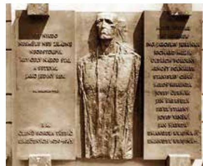
Pamětní deska sokolských obětí II. světové války

Vzrůstající činnost jednoty byla zcela jistě podnětem k úvahám nad stavbou vlastní sokolovny. Uplynulo jenom deset let od založení jednoty, když o velikonočních svátcích na jaře roku 1892 koupili činovníci jednoty od hostinského Janovského