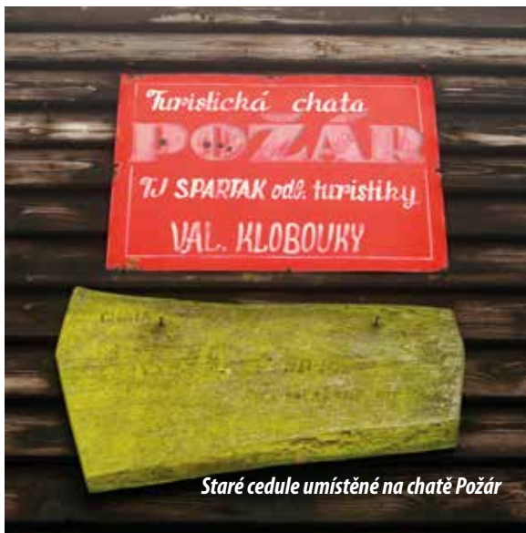
Staré cedule umístěné na chatě Požár