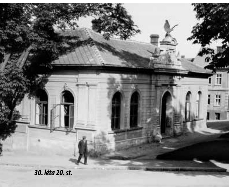
30. léta 20. st.