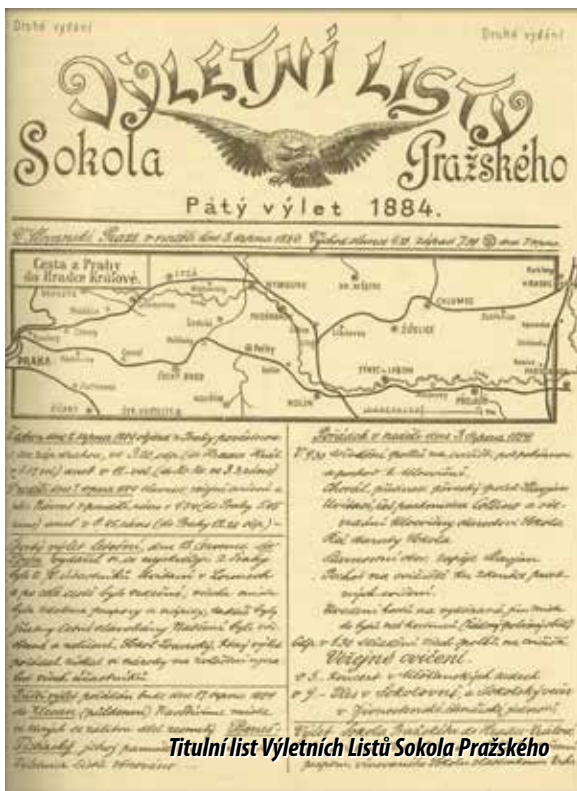
Titulní list Výletních Listů Sokola Pražského

Další z uložených krabiček se nachází v okolí hory Říp a připomíná tradiční sokolské výlety po významných, památných a zajímavých místech českých zemí.