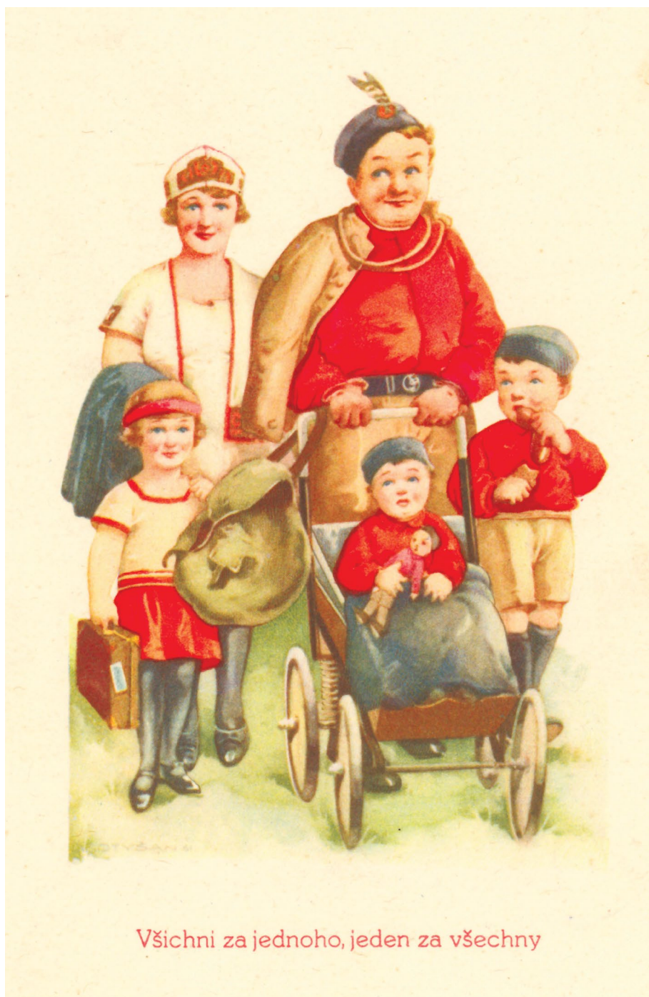
Všichni za jednoho, jeden za všechny